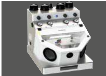
Cemmat-4 II (auch erhältlich als 3- und 2-Kammer-Ausführung)

Optimal abgestimmt auf die Verwendung mit unseren Feinstrahlgeräten.