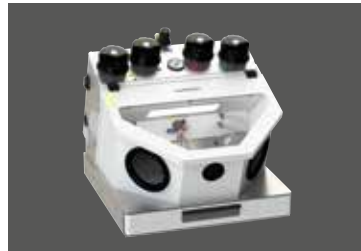
Gobi Comfort-4 (auch erhältlich als 3- und 2-Kammer-Ausführung)