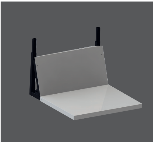
Tischgestell als Zubehör erhältlich