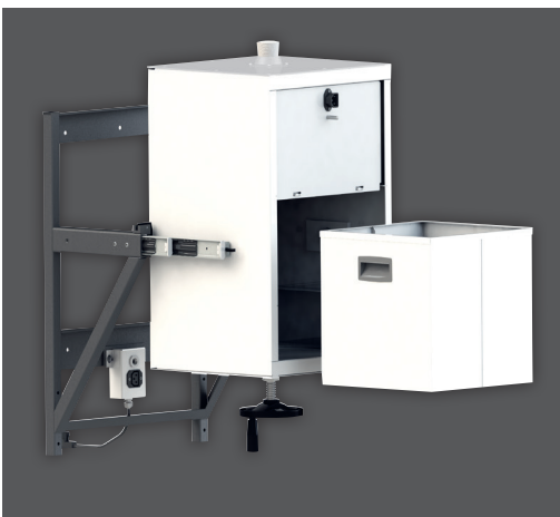
Kraft- und zeitsparende Befüllung