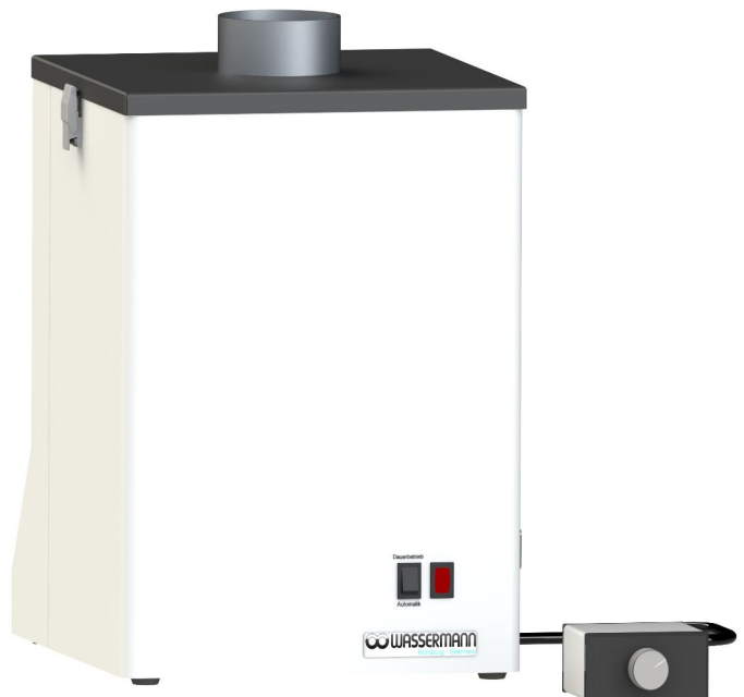
SG-1/1 II Comfort (140991) mit optionaler Drehzahlregelung (140480)