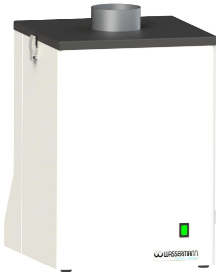
SG-1/1 II (140995)